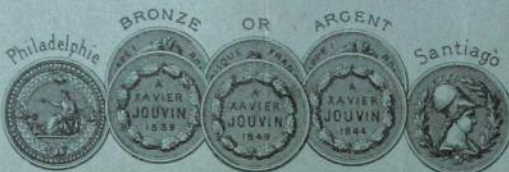
VIENNE 1873 GRAND DIPLÔME D'HONNEUR