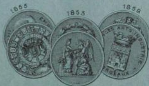
PARIS 1878 HORS CONCOURS - MEMBRE DU JURY